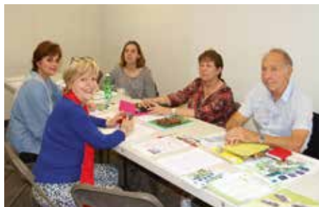
Nos bénévoles lors de cette journée