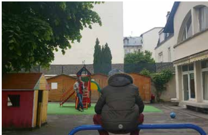
IME Bernadette Coursol

Tout ceci n'est pas encore du domaine de l'inclusion scolaire, mais le temps partagé avec les dispositifs de droit commun (l'enfant accueilli dans un IME bénéficie aussi d'un temps dans une classe en fonction de ses besoins et de ses capacités) est une avancée importante vers l'inclusion.